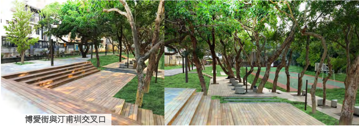
博愛街與汀甫圳交叉口